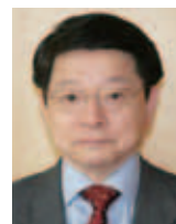
片山 善博氏 (かたやまよしひろ) 慶應義塾大学法学部教授 元総務大臣

1951年岡山市生まれ。74年東京大学法学部卒業、自治省に入省。能代税務署長、自治大臣秘書官、自治省国際交流企画官、鳥取県総務部長、自治省固定資産税課長などを経て、99年鳥取県知事(2期)。07年4月慶應義塾大学教授。10年9月から11年9月まで総務大臣。同月慶應義塾大学に復職し現在に至る。併せて、鳥取大学客員教授、「民事司法を利用しやすくする懇談会」議長、「デジタル文化財創出機構」理事、日本郵便「切手アドバイザー・グループ」委員などを務める。